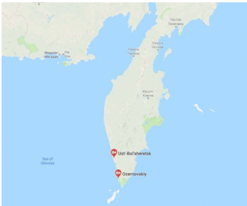
Конечные точки ВОЛС

Общая протяжённость линии связи составит 158 км, а затраты на проект оцениваются в 126 млн руб. Прокладку ВОЛС выполнит "Ростелеком", который выиграл соответствующий конкурс. Работы по проектированию, инженерные изыскания и закупка материалов будут оплачены из местного бюджета, на что власти Камчатского края выделили 66 млн руб. Реализация проекта позволит подключить к высокоскоростному интернету более 2 тыс. человек. Работы должны быть завершены в течение 1,5 лет.