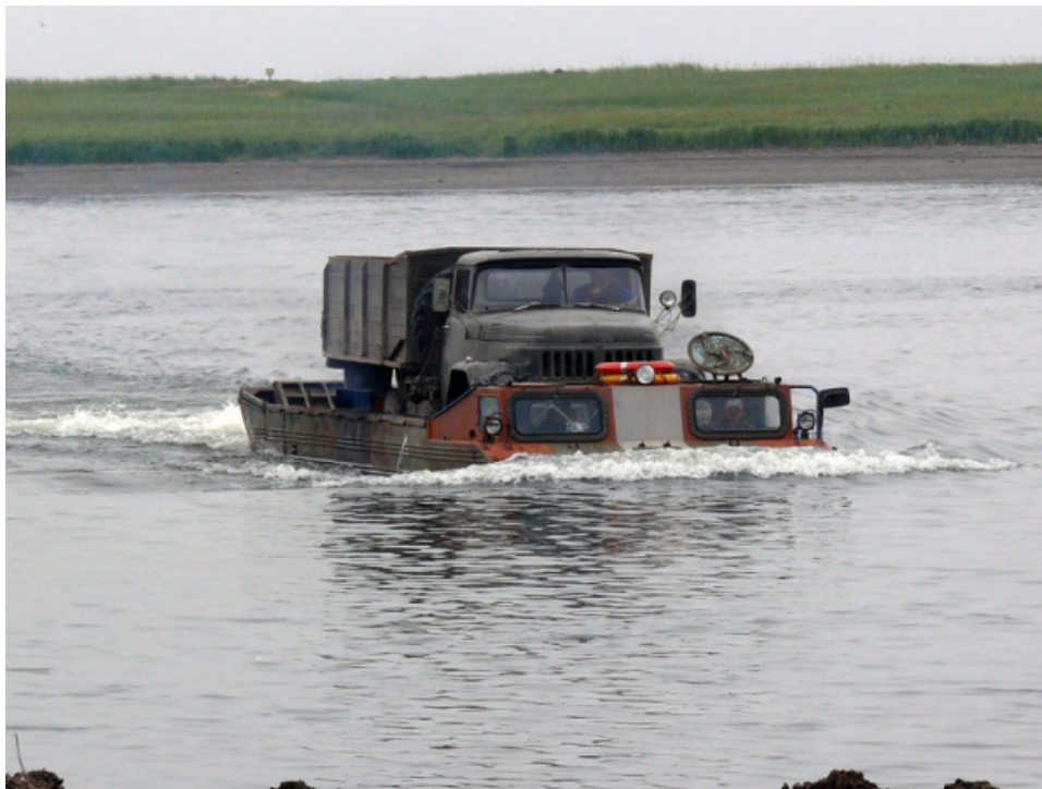
Переправа через р. Большая по дороге в Озерновский

Поселок Озерновский находится на берегу Охотского моря и считается одним из самых труднодоступных населенных пунктов Камчатки. К примеру, в районный центр Усть-Большерецк можно добраться только по грунтовой дороге через несколько переправ или самолетом/вертолетом. В 2018 году в поселке проживало около 1,5 тыс. человек. Местные жители заняты ловом нерки, других видов рыб, морепродуктов, а также на рыбоперерабатывающих предприятиях.